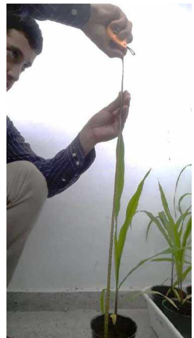
Fig. 2: Medición de altura en maíz

Las alturas de plantas mostraron diferencias significativas en la 4ta ( p=0,4732 para S y 0,0351 para B) y 5ta semana ( p=0,0126 para S y 0,153 para B). Se encontraron diferencias significativas tanto para peso de tallos ( <0,0001 y 0,001 ) a favor de S2 y CB como para peso de raíces ( p<0,0001 y p=0,0158 ) a favor de S2 y CB, respectivamente. En la Tabla 1 se observan los datos de la altura de plantas al terminar el ensayo en macetas, como también el peso de tallos y raíces.