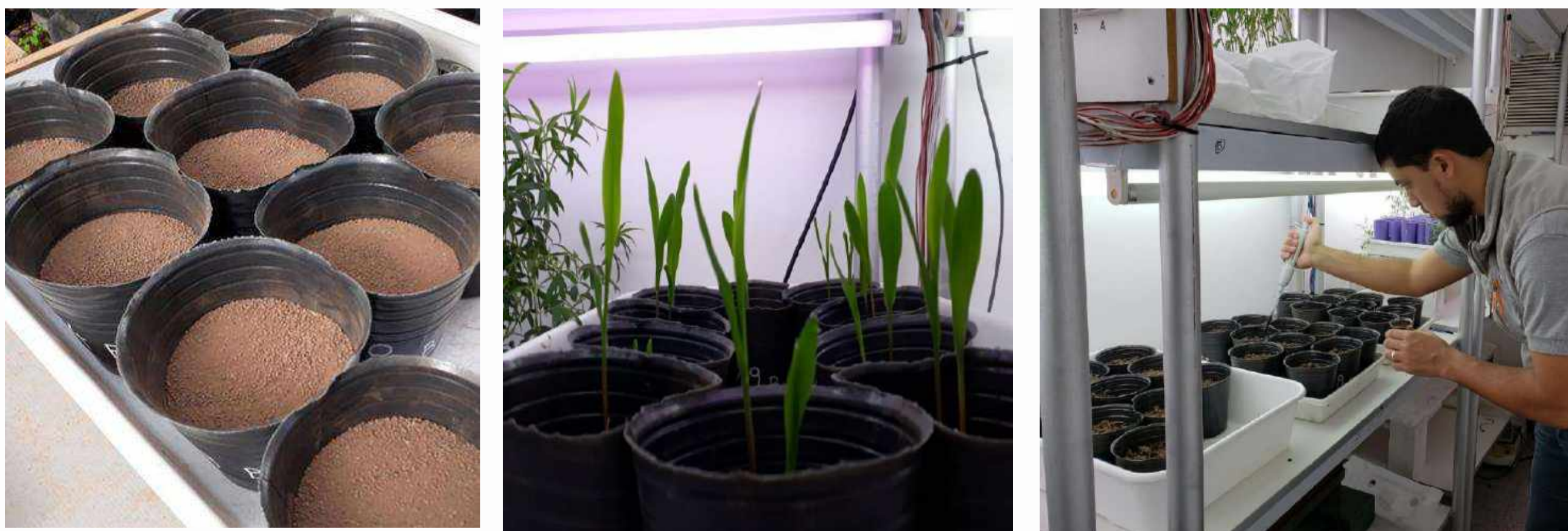
Fig. 1: Cámara de crecimiento con macetas y mediciones realizadas

Se sembraron 32 macetas en dos tipos de suelo (S1=Series Ensenada Grande de Corrientes y S2=Flecha de Pampa del Infierno Chaco), con (CB) y sin el uso (SB) de bioestimulante en el suelo de la maceta, a razón de 1,43 ml por maceta (Fig. 1). Se midió la altura de plantas semanalmente y luego de las 5 semanas se midió volumen radical, peso de tallo y raíces individuales. Los datos se analizaron con ANOVA y se realizó test de comparación con InfoStat (Di Rienzo et al, 2020).